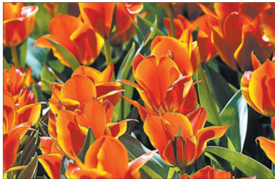
Sattes Orange-Rot: Nur eine der vielfältigen Tulpensorten in Gönningen

■ Infos zu Veranstaltungen, Öffnungszeiten der Kirche und des Museums: @ www.goenninger-tulpenbluete.de